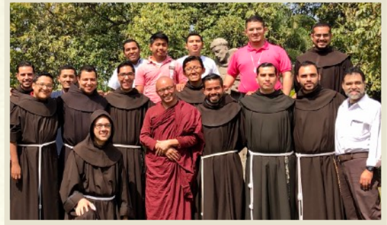
Serie de charlas del Dhamma para sacerdotes