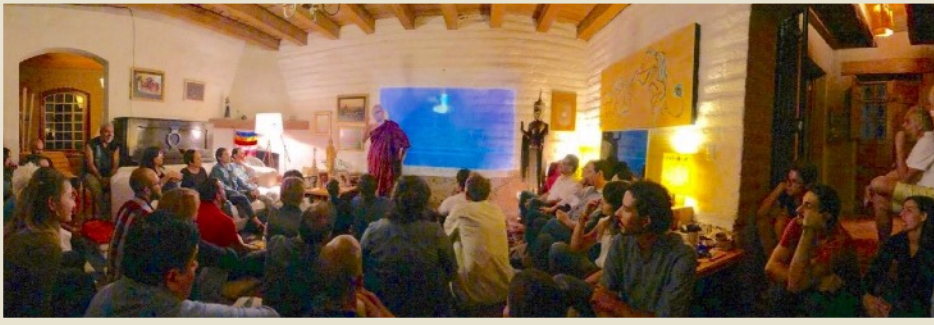
Clase semanal de anatomía de la mente para estudiantes de todas las edades