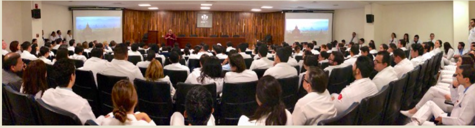
Charlas para desarrollar las Brahmavihāras para médicos