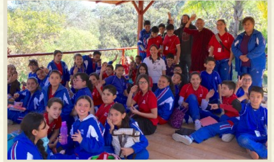
Charlas preventivas para niños