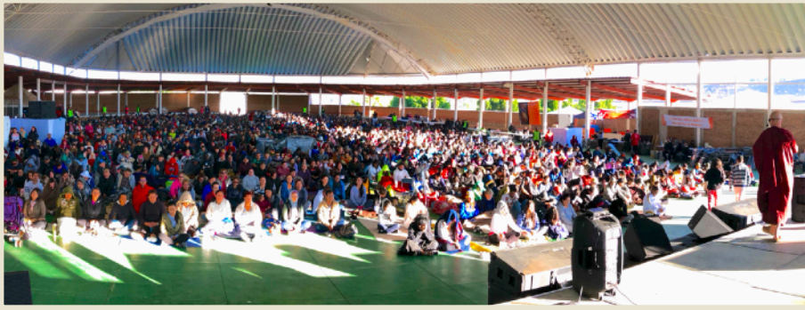
Conversaciones y práctica con padres de adictos