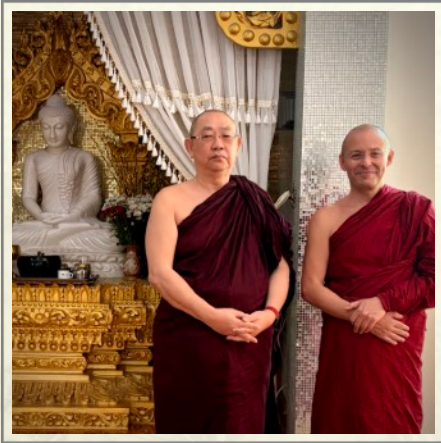
Sayadaw U Tejaniya