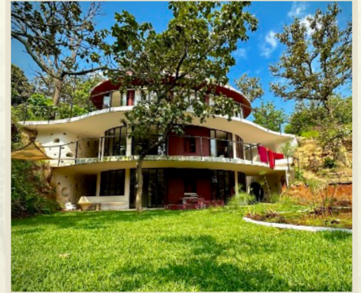
Construcción de Paññābhūmi , Centro Buddhista Mexicano